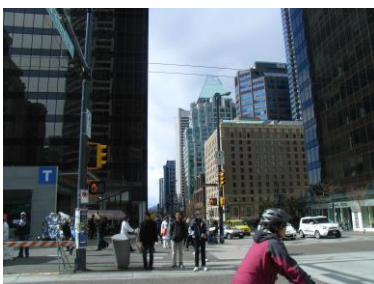
ダウンタウンの風景

バンクーバーはまだ冬の寒さが残っていました。山の上は雪が積もりスキーができました。街はとてもきれいで、都心でも東京のような人ごみはありませんでした。